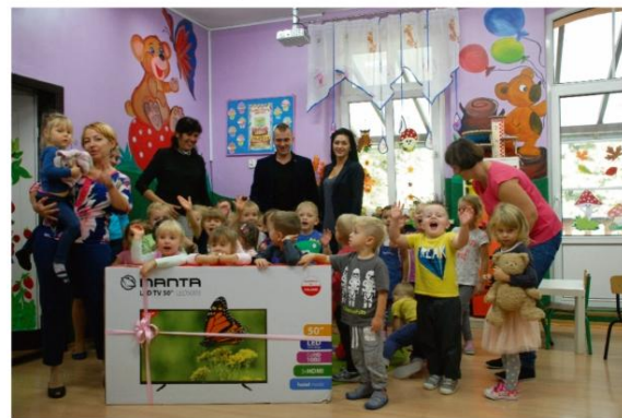
Fot. PS Zaborze