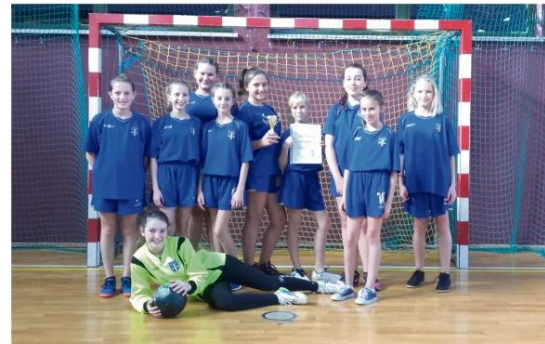
Zwycięska drużyna z Włosienicy.

Kolejnym rywalem miała być na wyjeździe ekipa Victorii Gaj, ale mecz został odwołany. Wszystko przez kontrowersyjną decyzję pani sędzi, która miała prowadzić zawody. Jej zdaniem boisko nie nadawało się do gry. Podróż do Gaju (gmina Mogiła) okazała się zatem bezcelowa, choć jedna i druga drużyna była gotowa do gry. Później wiceliderki z Brzezinki miały się spotkać na swoim terenie z Tuchowią. Okazało się, że drużyna z Tuchowa nie dotrze na miejsce, gdyż ma olbrzymie problemy kadrowe.