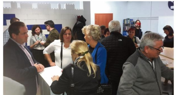
1+1 została otwarta 6 listopada.

Inicjatorem powołania Spółdzielni Socjalnej "1+1" było działające od 2005 roku Stowarzyszenie Edukacji Pozaformalnej "Meritum" z Krakowa. Trzy lata temu powołało ono pierwszy