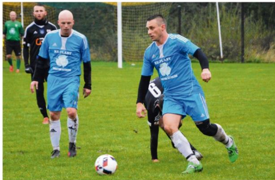
Piłkarze z Rajska w półfinale Pucharu Polski wygrali z Unią, ale w wielkim finale zostali zatrzymani przez solarzy.